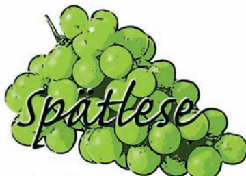
Seniorenbegegnungsstätte St. Johannes-Verein Niedernberg e.V.